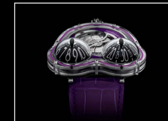
HM3 FROG X FACE PURPLE