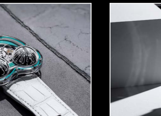
HM3 FROG X LIFESTYLE TURQUOISE