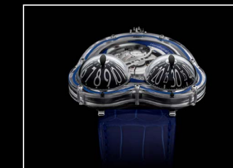
HM3 FROG X FACE BLUE