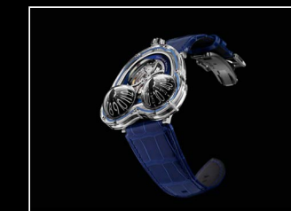
HM3 FROG X FRONT BLUE