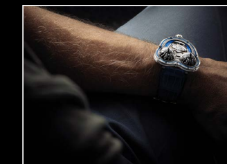
HM3 FROG X WRISTSHOT BLUE