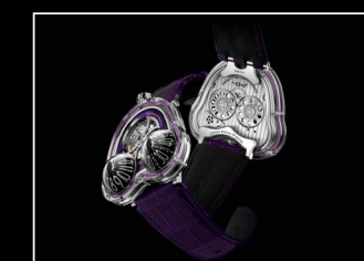
HM3 FROG X PURPLE