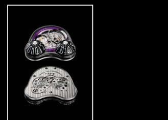
HM3 FROG X MOVEMENT PURPLE