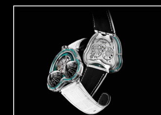
HM3 FROG X TURQUOISE