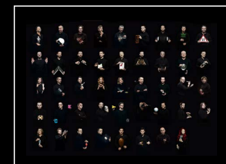
HM3 FROG X FRIENDS LANDSCAPE