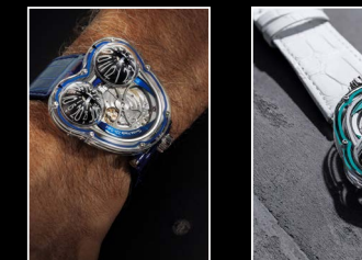
HM3 FROG X WRISTSHOT BLUE