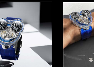
HM3 FROG X LIFESTYLE BLUE