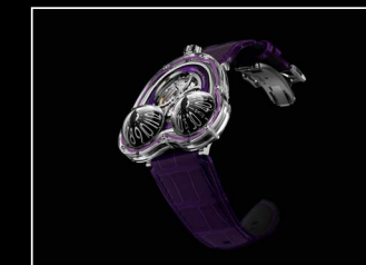
HM3 FROG X FRONT PURPLE