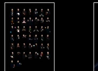
HM3 FROG X FRIENDS PORTRAIT