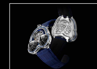
HM3 FROG X BLUE