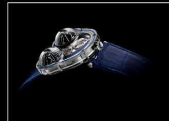
HM3 FROG X PROFILE BLUE