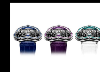
HM3 FROG X COLLECTION WHITE BACKGROUND