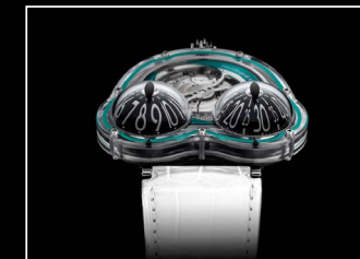
HM3 FROG X FACE TURQUOISE