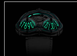
HM3 FROG X NIGHT TURQUOISE