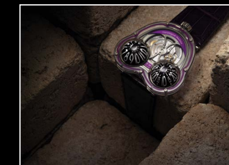
HM3 FROG X LIFESTYLE PURPLE