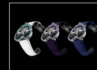
HM3 FROG X COLLECTION BLACK BACKGROUND