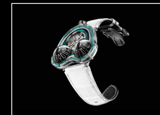
HM3 FROG X FRONT TURQUOISE