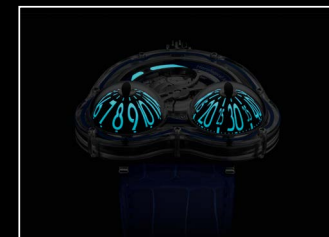
HM3 FROG X NIGHT BLUE