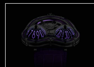
HM3 FROG X NIGHT PURPLE