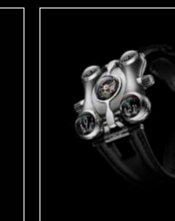
HM6 TI FRONT