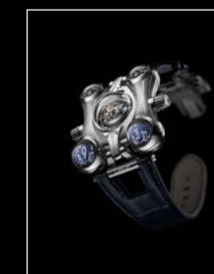
HM6 FE FRONT