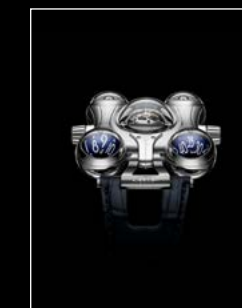
HM6 FINAL EDITION FACE