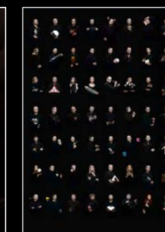
HM6 SERIES FRIENDS PORTRAIT