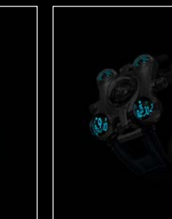
HM6 FINAL EDITION FRONT - NIGHT