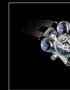
HM6 FINAL EDITION BACK