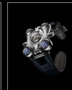
HM6 FINAL EDITION FRONT