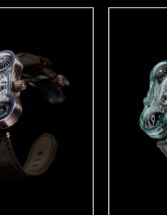
HM6 ALIEN NATION FRONT