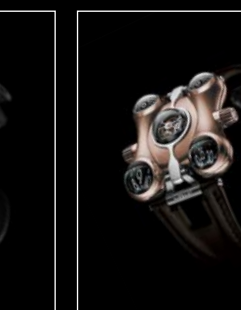
HM6 RT FRONT