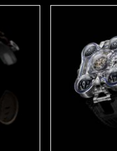
HM6 SV PLATINUM FRONT