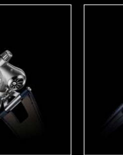
HM6 FINAL EDITION PROFILE