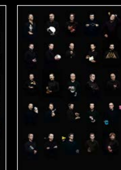
HM6 SERIES FRIENDS LANDSCAPE