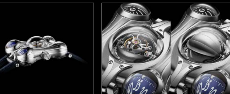
HM6 FINAL EDITION CLOSE UP TOURBILLON