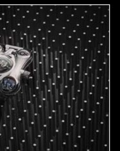
HM6 FINAL EDITION WRIST SHOT