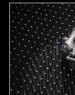
HM6 FINAL EDITION LIVE SHOT