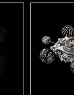
HM6 SERIE ENGINE 01