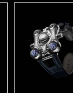
HM6 FINAL EDITION FRONT - SHIELD