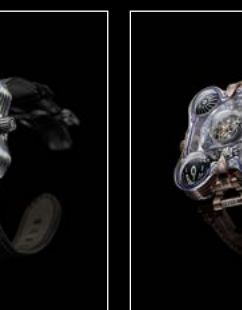
HM6 SV RED FRONT