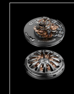
HM7 AQUAPOD ENGINE