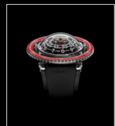
HM7 AQUAPOD PT RED FACE BLACK