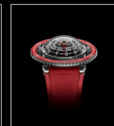
HM7 AQUAPOD PT RED FACE