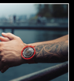
HM7 AQUAPOD PT RED CLOSE-UP