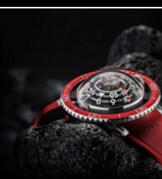
HM7 AQUAPOD PT RED CLOSE-UP