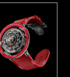
HM7 AQUAPOD PT RED FRONT