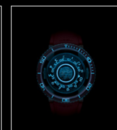
HM7 AQUAPOD PT RED TOP NIGHT