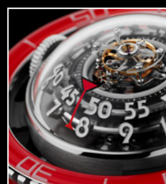
HM7 AQUAPOD PT RED CLOSE-UP