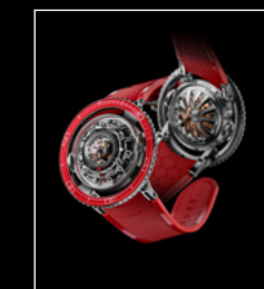
HM7 AQUAPOD PT RED