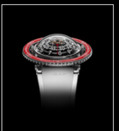
HM7 AQUAPOD PT RED FACE WHITE