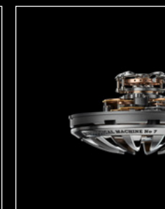
HM7 AQUAPOD ENGIN PROFILE