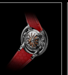
HM7 AQUAPOD PT RED BACK