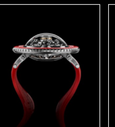
HM7 AQUAPOD PT RED PROFILE