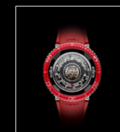
HM7 AQUAPOD PT RED TOP