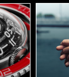
HM7 AQUAPOD PT RED CLOSE-UP