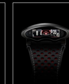
HMX RED FACE