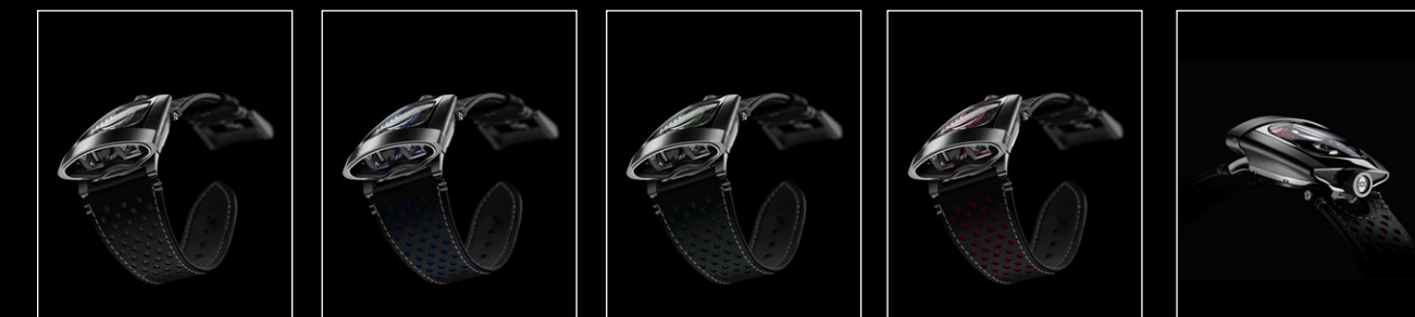
HMX BLACK FRONT