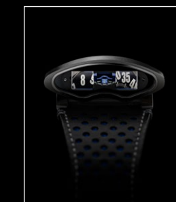
HMX BLUE FACE