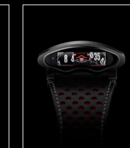
HMX RED FACE