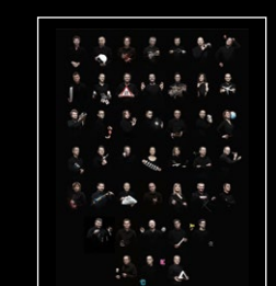
HMX FRIENDS PORTRAIT