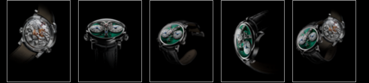
LM1 M.A.D. DUBAI BACK