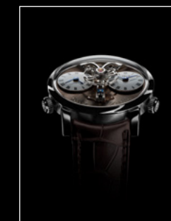
LEGACY MACHINE N°1 FINAL EDITION FACE