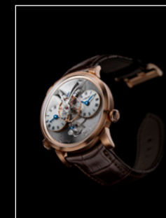
LEGACY MACHINE N°1 RED GOLD