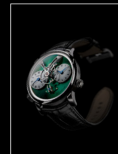
LEGACY MACHINE N°1 M.A.D. GALLERY DUBAI