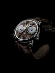
LEGACY MACHINE N°1 FINAL EDITION FRONT