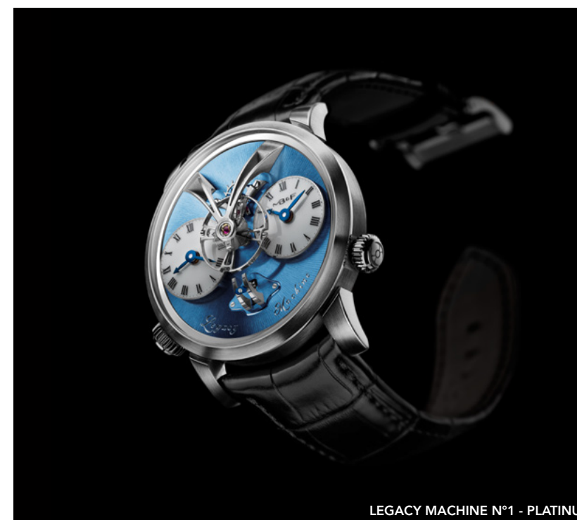
LEGACY MACHINE N°1 - PLATINUM

即便目前 Legacy Machine N°1 選擇退居後位，讓 MB&F 能有更多推陳出新的發揮空間，然而只要 Legacy Machine 的傳奇篇章繼續譜寫不懈，Legacy Machine N°1 的精神就能恆久流傳。