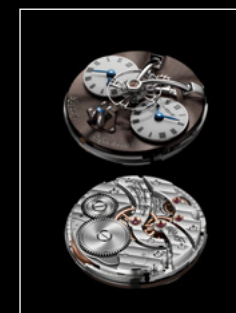
LEGACY MACHINE N°1 FINAL EDITION ENGINE