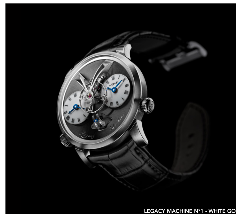
LEGACY MACHINE N°1 - WHITE GOLD