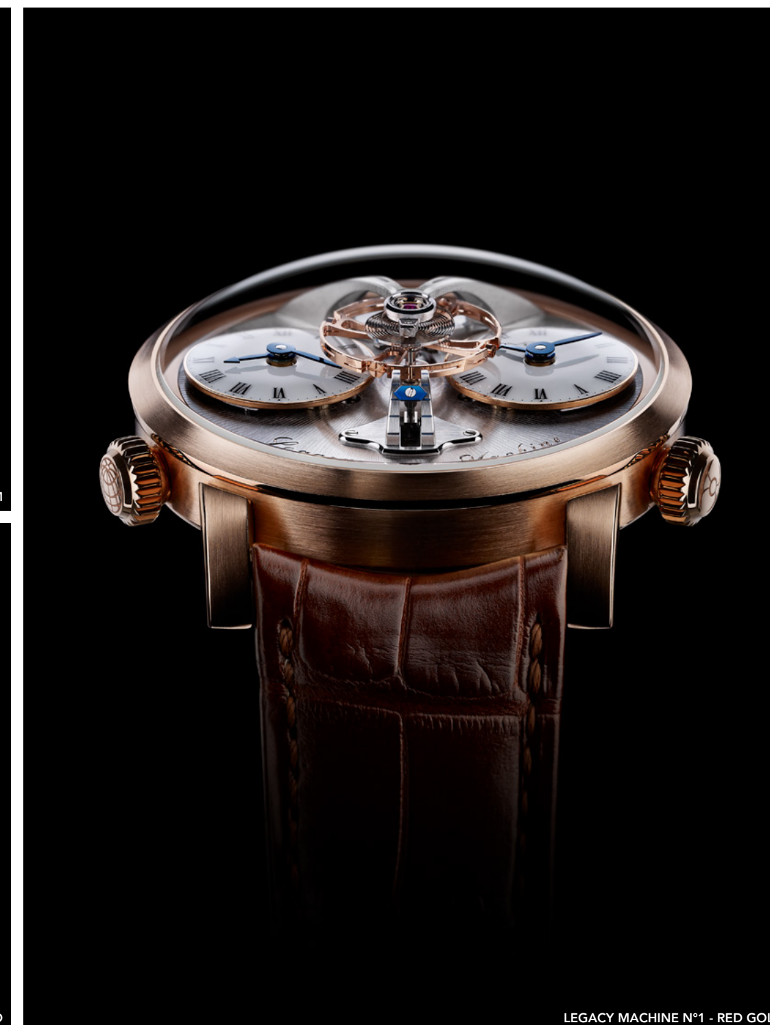
LEGACY MACHINE N°1 - RED GOLD