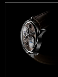
LEGACY MACHINE N°1 FINAL EDITION PROFILE