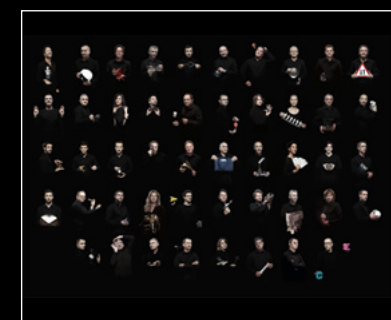
LEGACY MACHINE N°1 FRIENDS LANDSCAPE