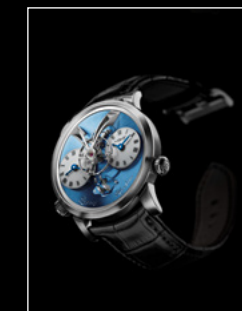
LEGACY MACHINE N°1 PLATINUM