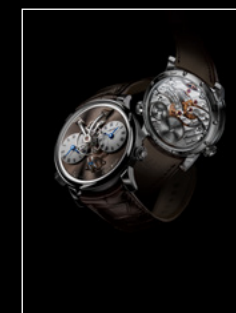
LEGACY MACHINE N°1 FINAL EDITION