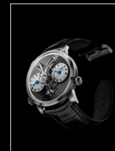
LEGACY MACHINE N°1 WHITE GOLD