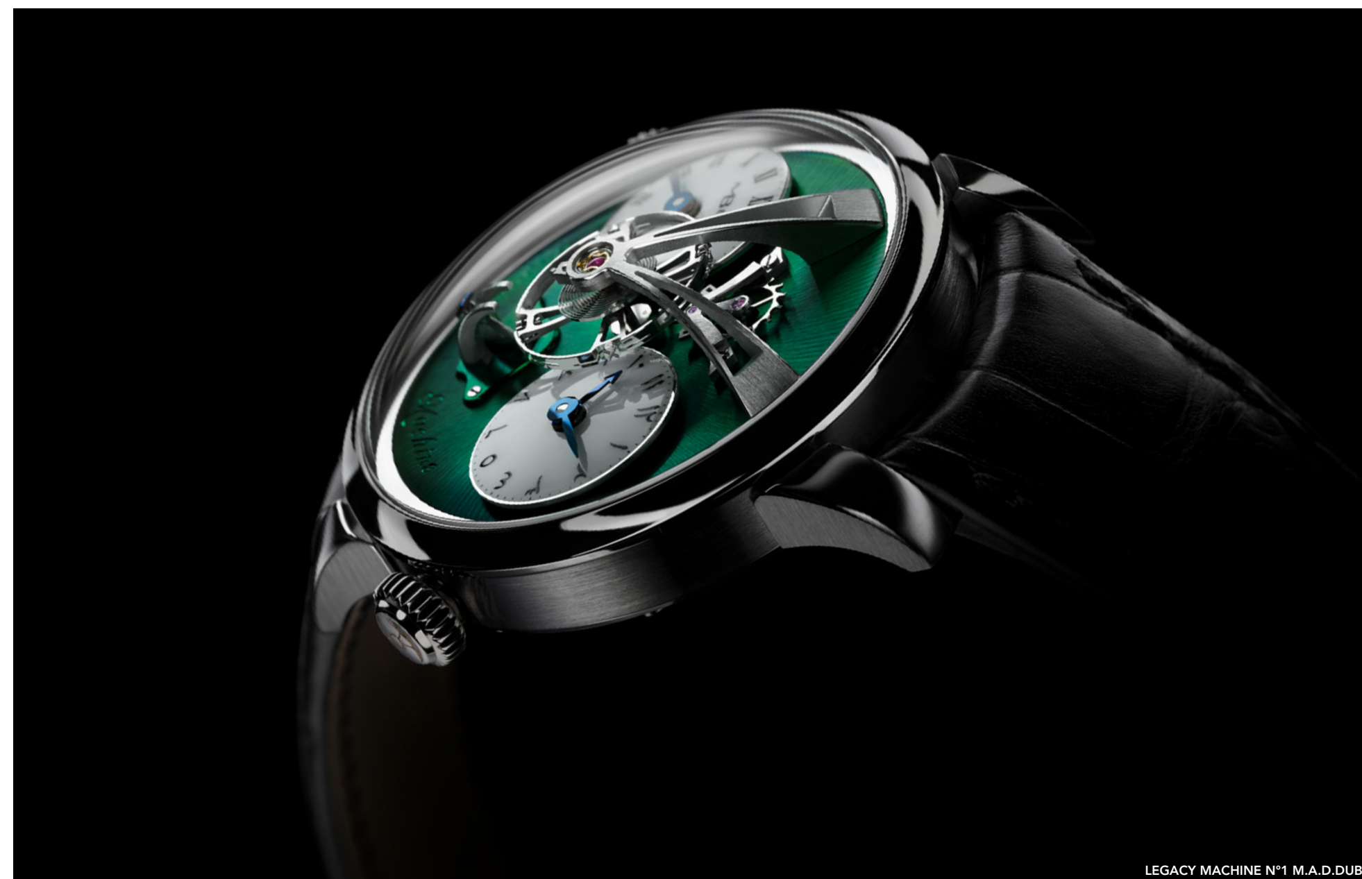
LEGACY MACHINE N°1 M.A.D. DUBAI