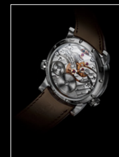
LEGACY MACHINE N°1 FINAL EDITION BACK