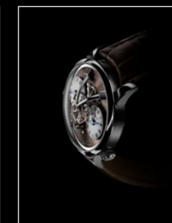
LEGACY MACHINE N°1 FINAL EDITION PROFILE