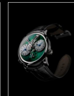
LEGACY MACHINE N°1 M.A.D. GALLERY DUBAI