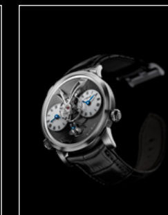
LEGACY MACHINE N°1 WHITE GOLD