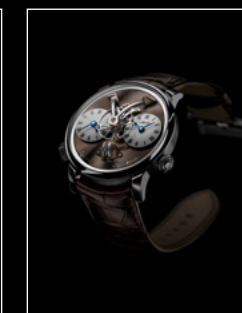
LEGACY MACHINE N°1 FINAL EDITION FRONT