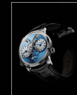
LEGACY MACHINE N°1 PLATINUM