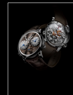
LEGACY MACHINE N°1 FINAL EDITION