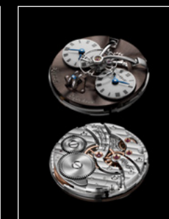
LEGACY MACHINE N°1 FINAL EDITION ENGINE