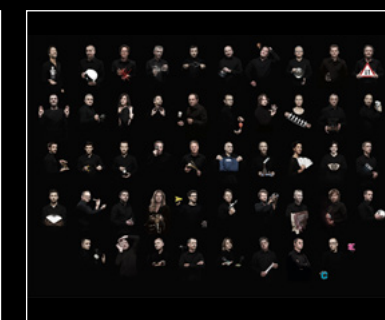
LEGACY MACHINE N°1 FRIENDS LANDSCAPE