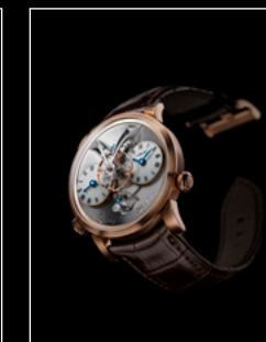
LEGACY MACHINE N°1 RED GOLD