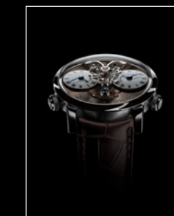
LEGACY MACHINE N°1 FINAL EDITION FACE