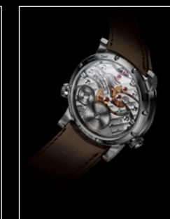
LEGACY MACHINE N°1 FINAL EDITION BACK