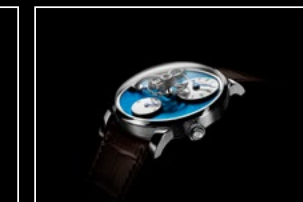
LM101 STEEL BLUE PROFILE