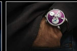
LM101 WG PURPLE WRISTSHOT