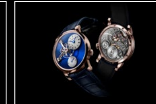
LM101 RG BLUE