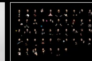
FRIENDS LM101 LANDSCAPE