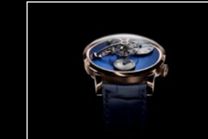
LM101 RG BLUE FACE