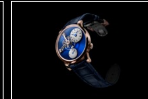
LM101 RG BLUE FRONT