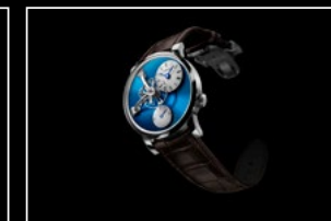
LM101 STEEL BLUE FRONT