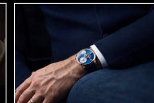
LM101 RG BLUE WRISTSHOT