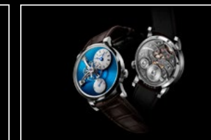
LM101 STEEL BLUE