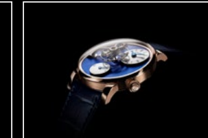
LM101 RG BLUE PROFILE