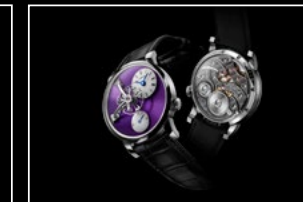
LM101 WG PURPLE