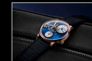
LM101 RG BLUE LIFESTYLE