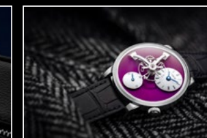
LM101 WG PURPLE LIFESTYLE