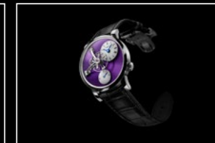
LM101 WG PURPLE FRONT