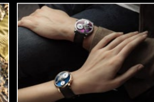
LM101 WG PURPLE & RG BLUE WRISTSHOT