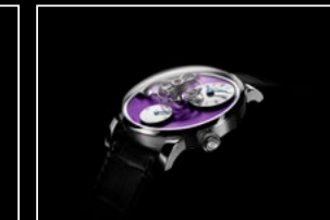
LM101 WG PURPLE PROFILE