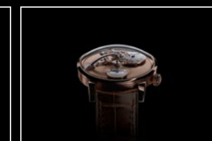
LM101 FROST RG