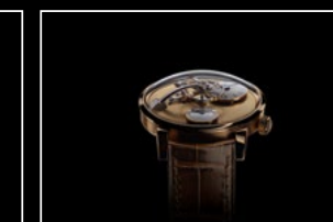
LM101 FROST YG