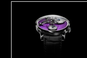
LM101 WG PURPLE FACE