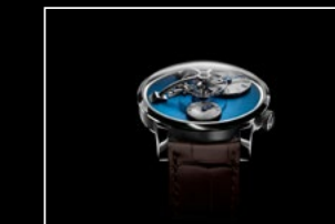
LM101 STEEL BLUE FACE