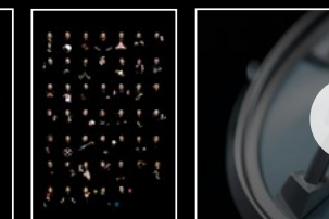
THE LM101 SERIES 2019