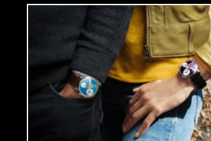
LM101 STEEL BLUE & WG PURPLE WRISTSHOT