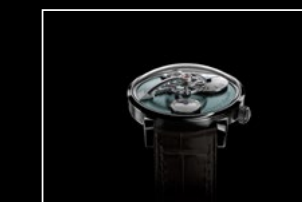
LM101 PALLADIUM FACE