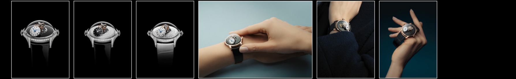
LM FlyingT LAQUE FACE