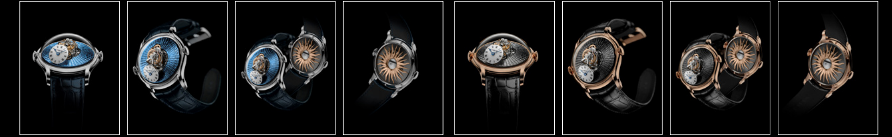
LM FlyingT PT FACE