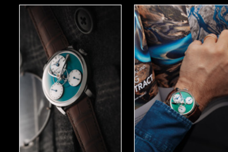
LM SE GREEN IN SITU 01